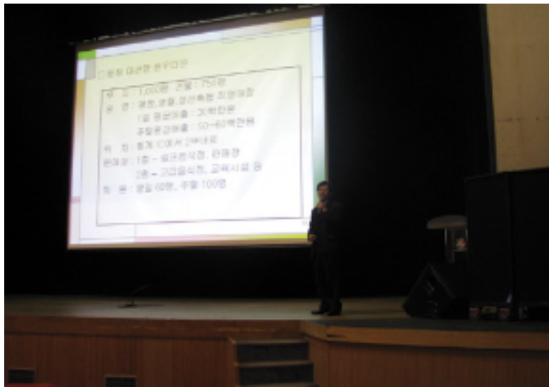
클러스터사업단장의 사업 설명회 모습

이 교육은 축산농가에게 가장 중요한 질병과 예방에 대하여 질병의 개념, 송아지 질병, 비육 및 번식우의 주된 질병, 전염성 질병, 소 내부 기생충 구제 및 예방, 우군의 질병발생 예방을 위한 조치 등 한우를 사육하는데 번식률을 높일 수 있고, 폐사의 원인을 줄일 수 있는 알찬 내용들로 진행되었다.