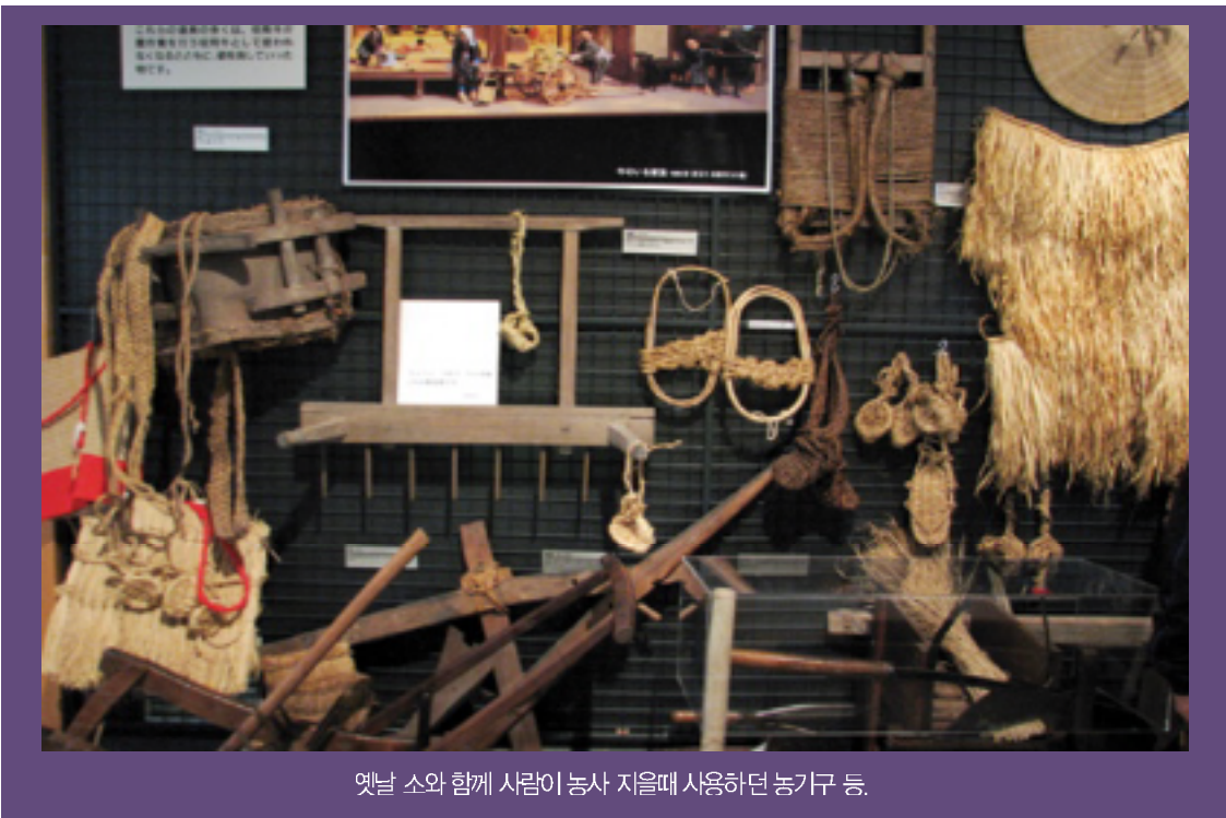
옛날 소와 함께 사람이 농사 지을때 사용하던 농기구 등.

다지마소는 뼈가 가늘고 뿔이 강하며 피부가 부드럽고 등, 허리가 평평하면서 거친 사료에 견디는 힘이 강하다는 이야기란다. (국우10도: 1310년정)