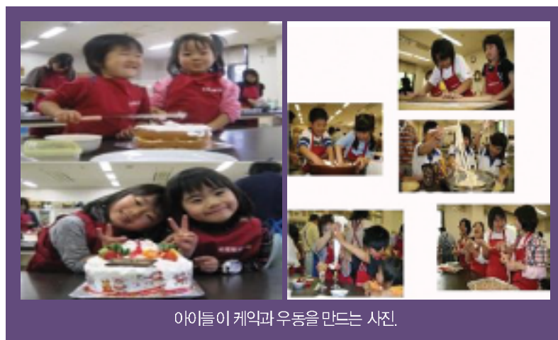
아이들이 케익과 우동을 만드는 사진.

12월의 이벤트에는 '보다 빠른 크리스마스'를 하면서 500엔(약 8,000원)의 참가비를 받으며 50명 한정예약을 받고 우동 만들기, 크리스마스 케익 만들기(1,300엔)등 다양한 이벤트를 만들어서 목장을 활용하고 있었다.