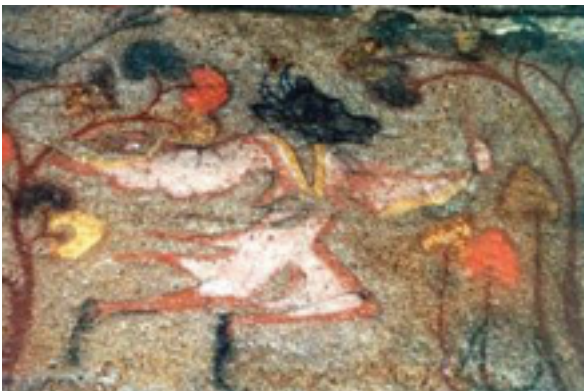
(그림: 농사의 신(소) 고구려고분벽회중 -6세기경)

그분이 은혜를 갚으려고 소의 묘지를 썼는지 안 썼는지 그것도 궁금하고 흥천에도 그런 한우가 있었다는 것도 확인하고 싶기도 하고 소를 길러 돈을 버는 것도 중요하지만 소에게 감사하고 고맙게 생각하며 30이 넘는 늙은 소를 잘 돌보는 그 농부의 마음이 너무너무 아름다웠습니다.