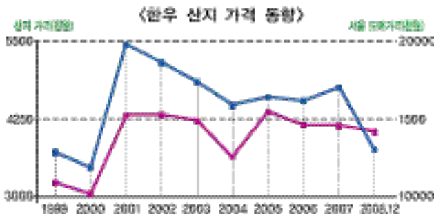
자료 : 축산 사이버 컨설팅 인터넷

지금도 한우 거세우를 비육하는 농가에서는 등급판정「B1+」이상만 판정을 받는다고 하면 번식우 경영이나 일반수소 비육하는 농가보다는 경영상 안정적인 가능성이 높다.